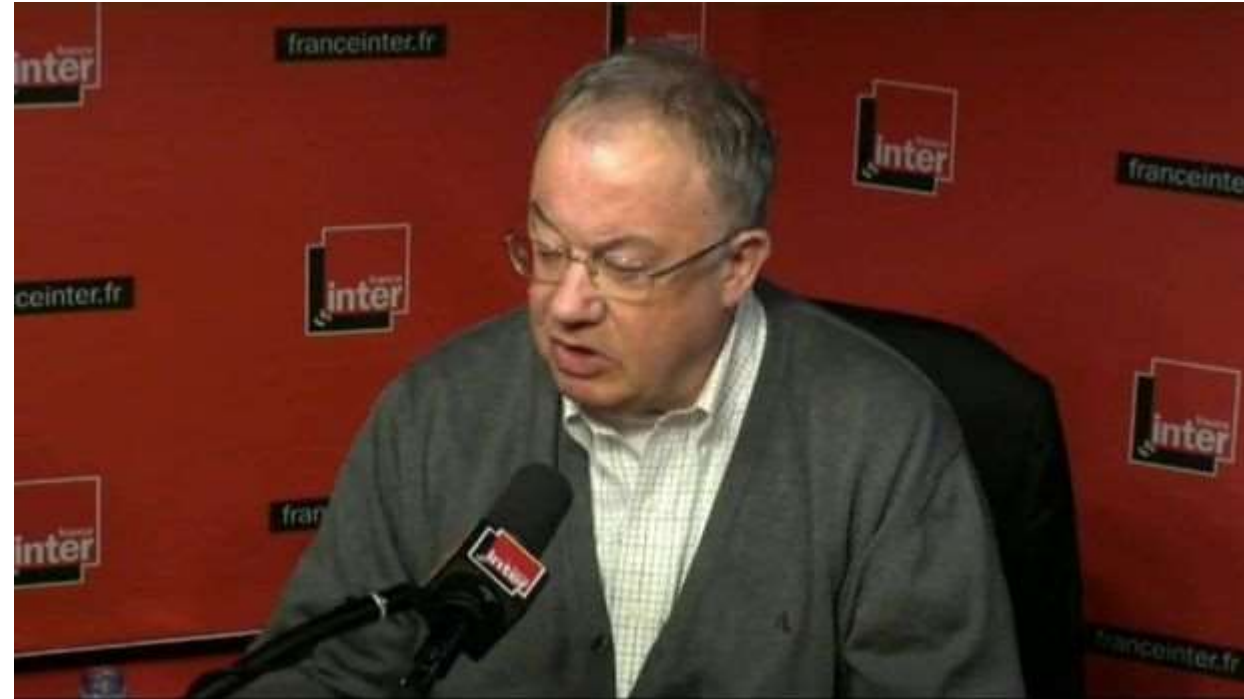
Olivier Roy tijdens een recent radio-interview

http://www.knack.be/nieuws/wereld/olivier-roy-terrorisme-beperkt-zich-tot-de-tweede-generatie-en-bekeerlingen/article-normal-629509.html